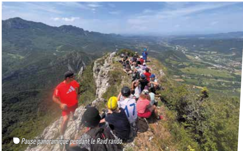
● Pause panoramique pendant le Raid rando.