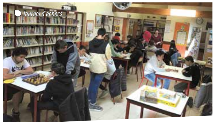
● Tournoi d'échecs...

Le site internet de l'établissement « www.saintfrancoislesgoelands.com » diffuse des photos et vidéos des temps forts, ainsi que toutes les informations pratiques et administratives.