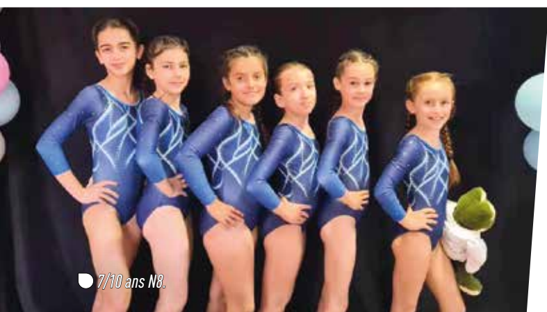
7/10 ans N8.