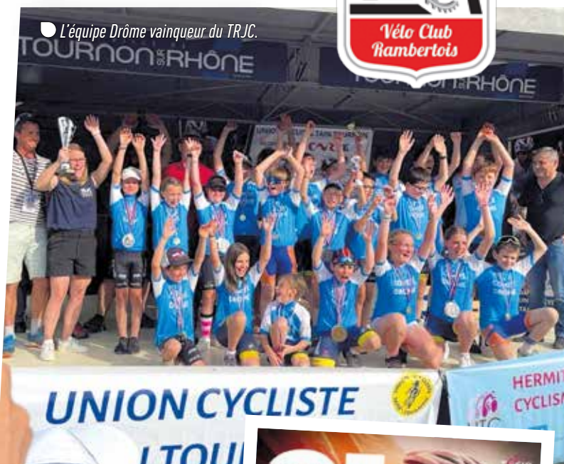
L'équipe Drôme vainqueur du TRJC.