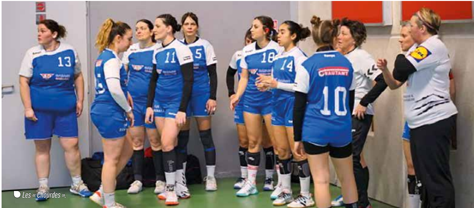
Les « Chourdes ».