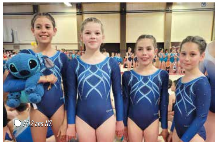
7/12 ans N7.

Pour clôturer la saison, la journée de fin d'année aura lieu le 1 er juillet dans notre salle spécialisée.