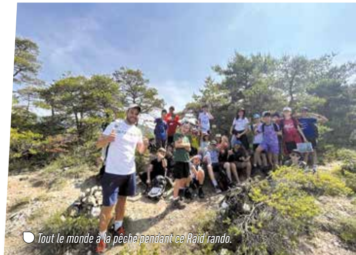
● Tout le monde à la pêche pendant ce Raid rando.