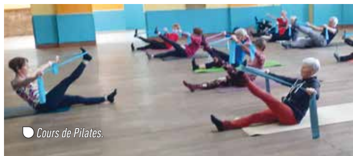
● Cours de Pilates.