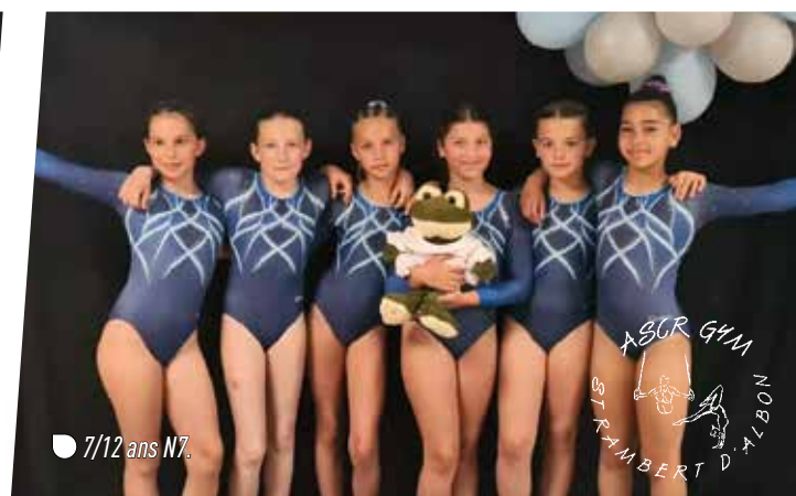
7/12 ans N7.

Les N6 11/15 ans se sont qualifiées en finale nationale après avoir été championnes départementales, 4 e en région, 5 e en 1/2 finale, elles terminent à la magnifique 5 e place sur 13 équipes. Que de beaux résultats et progrès