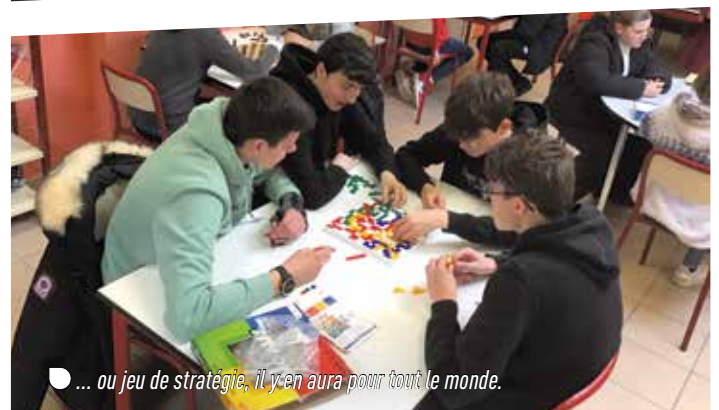
● ... ou jeu de stratégie, il y'en aura pour tout le monde.